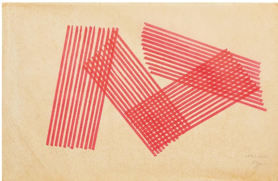
Rana Begum, WP 412 , 2020

All press images (300dpi) can be downloaded free of charge via photofiles.de/dbpalaispopulaire . Please note, that the publication of picture files is permitted only for press purposes and with the corresponding credit lines. We kindly request to send two proof copies when an image is reproduced.