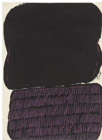
Georg Karl Pfahler