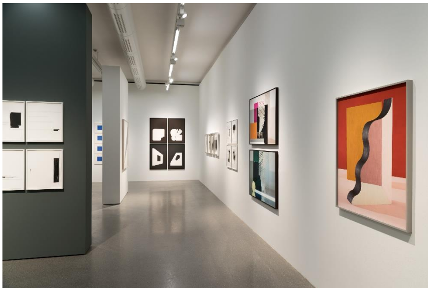
Installationsansicht / Installation view

Leihgabe der Künstlerin und Galerie Sies+Höke / lent by the artist and the gallery Sies+Höke