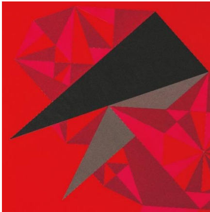
Adriana Czernin, Ibn Tulun 98 , 2018

Acryl, Buntstift, Bleistift, Kreide auf Papier 115 × 115 cm / acrylic, colored pencil, pencil, crayon on paper, 115 × 115 cm