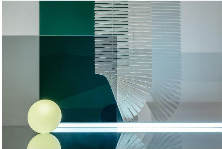
Kapwani Kiwanga, Counter-Illumination #2 , 2020

Farbiger C-Print auf Glanzpapier, 80 × 120 cm / C-Print on glossy paper, 80 × 120 cm