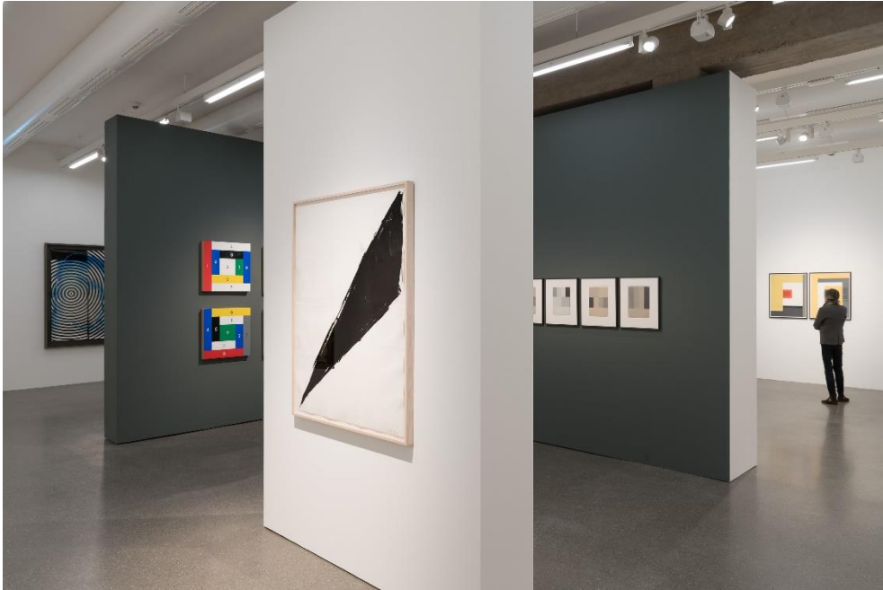
Installationsansicht / Installation view

Ways of Seeing Abstraction – Works from the Deutsche Bank Collection (27.3.2021 – 7.2.2022)