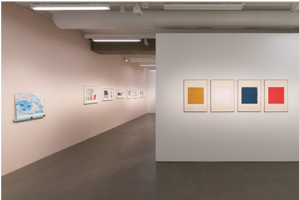
Installationsansicht / Installation view

Ways of Seeing Abstraction – Works from the Deutsche Bank Collection (27.3.2021 – 7.2.2022)