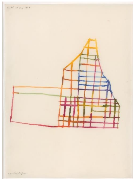
Olav Christopher Jenssen, Ohne Titel / Untitled , 1996

Papier, in japanischem Wachs getränkt (1 von 6), 76 x 56.2 cm /