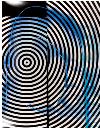
Fabian Marti, Ohne Titel / Untitled,, 2011

Silbergelatine-Abzug (Fotogramm) Original, 180 × 145 cm, gerahmt /